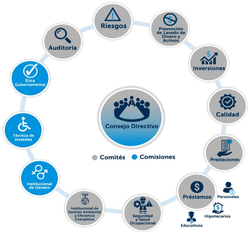
Imagen 1: Comités y Comisiones de apoyo en el IPSFA