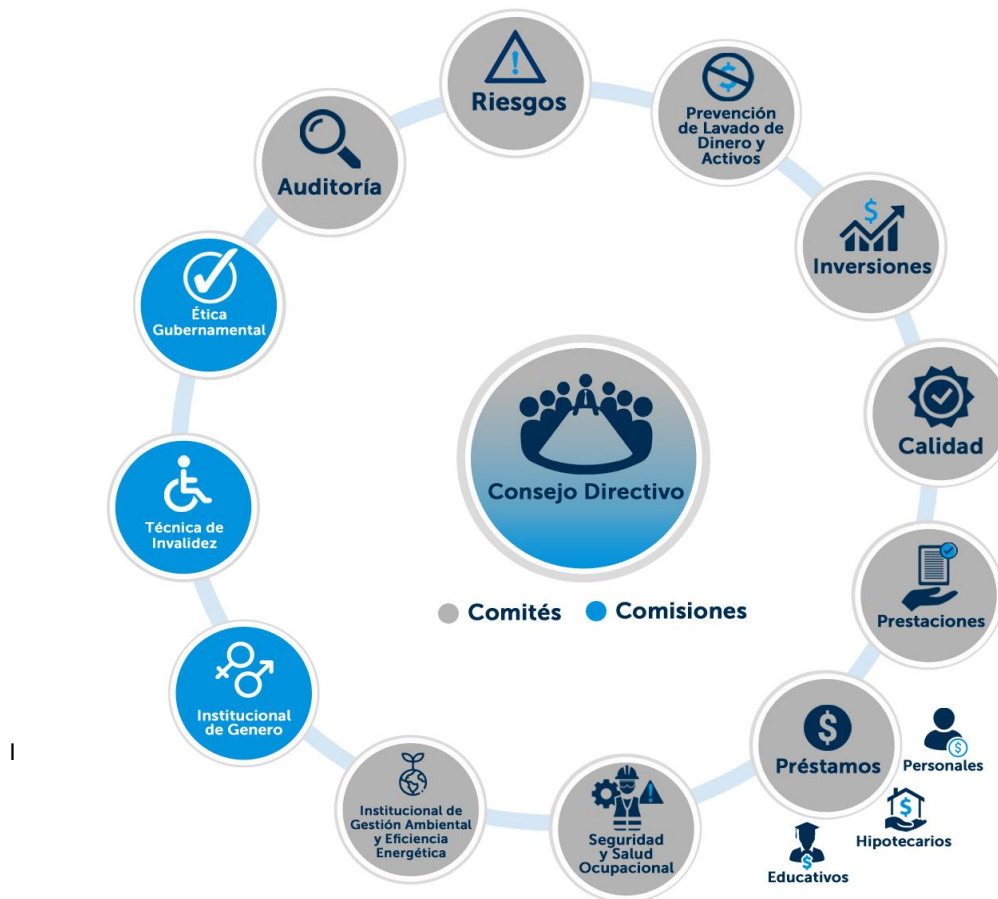
Imagen 1: Comités y Comisiones de apoyo en el IPSFA

Los Comités y Comisiones de apoyo para el adecuado ejercicio de función y control, están definidos de conformidad a lo previsto en la Ley del IPSFA, Ley de Supervisión y Regulación del Sistema Financiero, Normas Técnicas de Control Interno Específicas del IPSFA, Código de Gobierno Corporativo del IPSFA IPSFA-CD-CO-01, Política de Gobierno Corporativo IPSFA-CD-PO-01; todos determinados para el eficiente cumplimiento de los objetivos Institucionales y los asignados a cada comité.